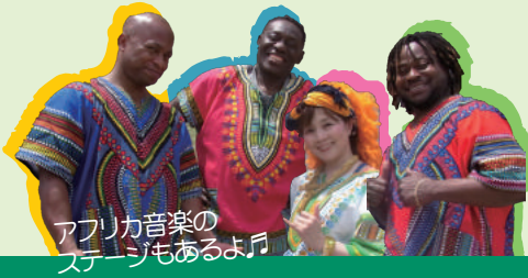
アフリカ音楽の ステージもあるよ!